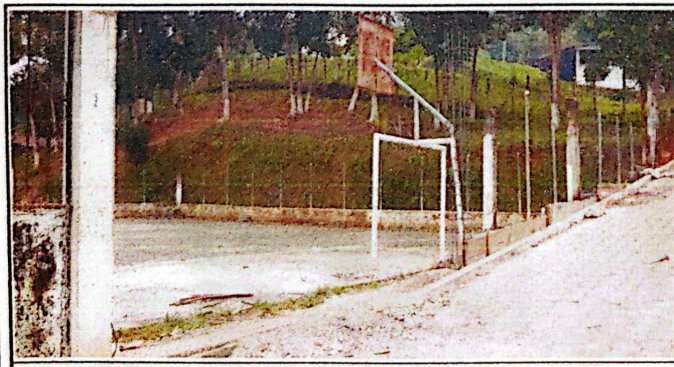
En esta fotografía se observa la sustitución de el muro perimetral.