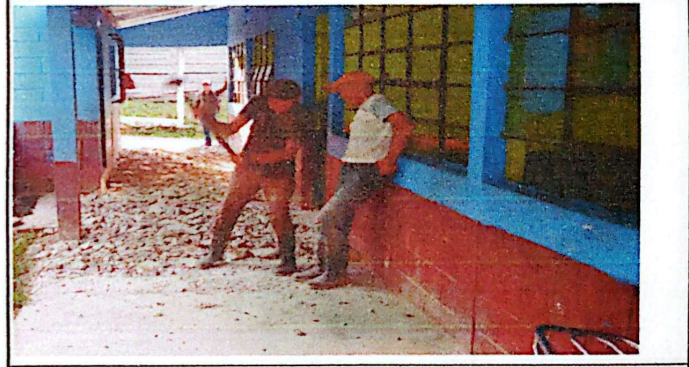
En esta imagen se ve el cambio de piso del corredor que por estar deteriorado es necesario reemplazarlo.