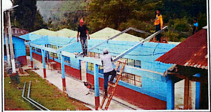
Acá se observa el cambio de la estructura de madera por estructura de metal.