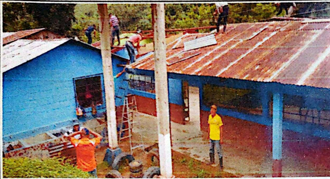
En esta imagen se observa cuando se empieza a quitar las láminas deterioradas y el desarme de la estructura de madera.