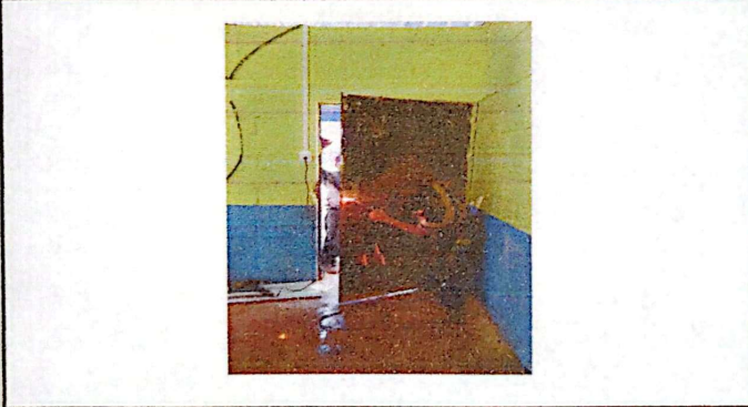
En esta imagen se observa el cambio de chapas de una de las 8 puertas que se van a sustituir.